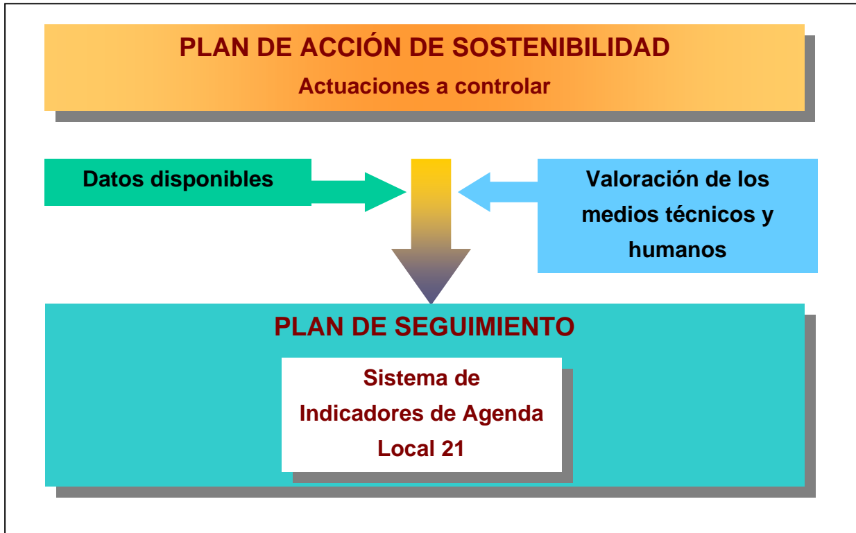
Estructura del Plan de Seguimiento